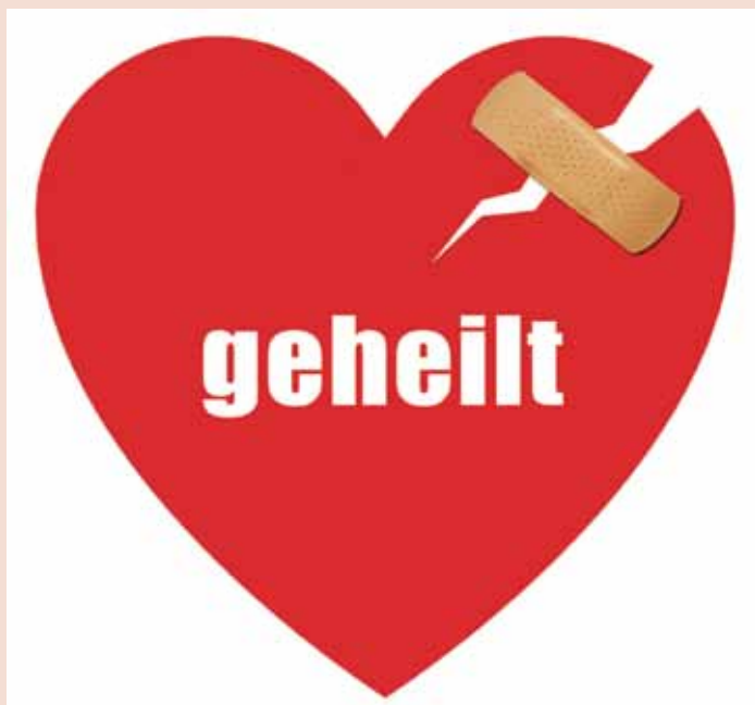
Flyer in Herzform

Der Spirit des Leitungskreises färbt auf alle Mitarbeiterinnen und Mitarbeiter ab. Die Ideen und Visionen des Leitungskreises färben auf die Gottesdienste ab. Daher gab es mehrere Visionssitzungen und Klausurwochenenden, in denen das ausführliche, persönliche Feedback und das Visionieren über die Zukunft von himmelwärts und der Jungen Gemeinde im Vordergrund standen. Wir haben das als große Bereicherung und als Stärkung des Gruppenzusammenhalts empfunden.